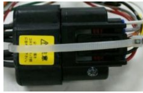
タイラップで固定