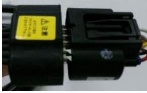
黄色シール ロック部分