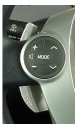
パドルシフト「-」 (左側)