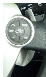
パドルシフト「+」 (右側)